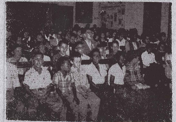
LA CUMBRE. — Vista parcial de una de las reuniones efectuada durante la II Convención Juvenil del Valle.

turarla nuevamente. Se ve que un individuo, o sus parientes, quienes en los días de bienestar se muestran completamente indiferentes a